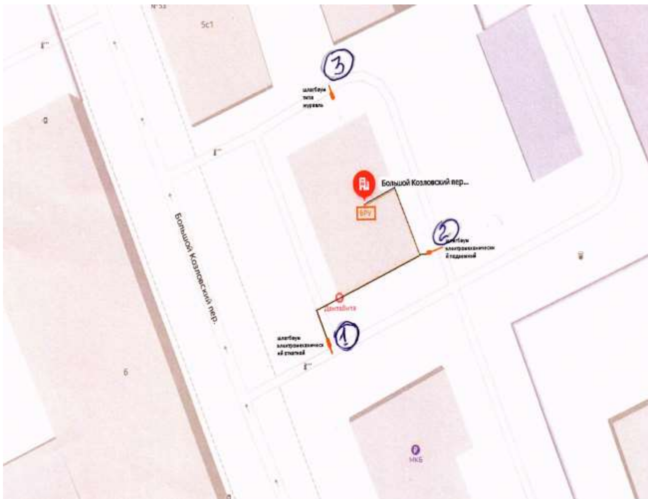
Схема размещения ограждающих устройств